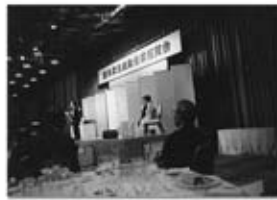
日本写真家協会会長 田沼武能氏のご挨拶