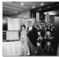
晴れの奥田ご夫妻