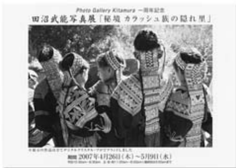
Photo Gallery Kitamura 1周年記念

2007年4月26日 (木) ~ 5月9日 (水) 東京・新宿・フォトギャラリー・キタムラ